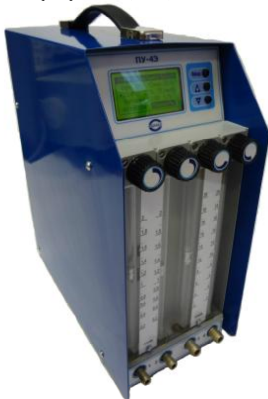
Рис. 9 Аспиратор ПУ-3Э («220»), ПУ-3Э исп.1 («12»)